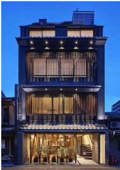
1階 68.97 m 2 20.86坪